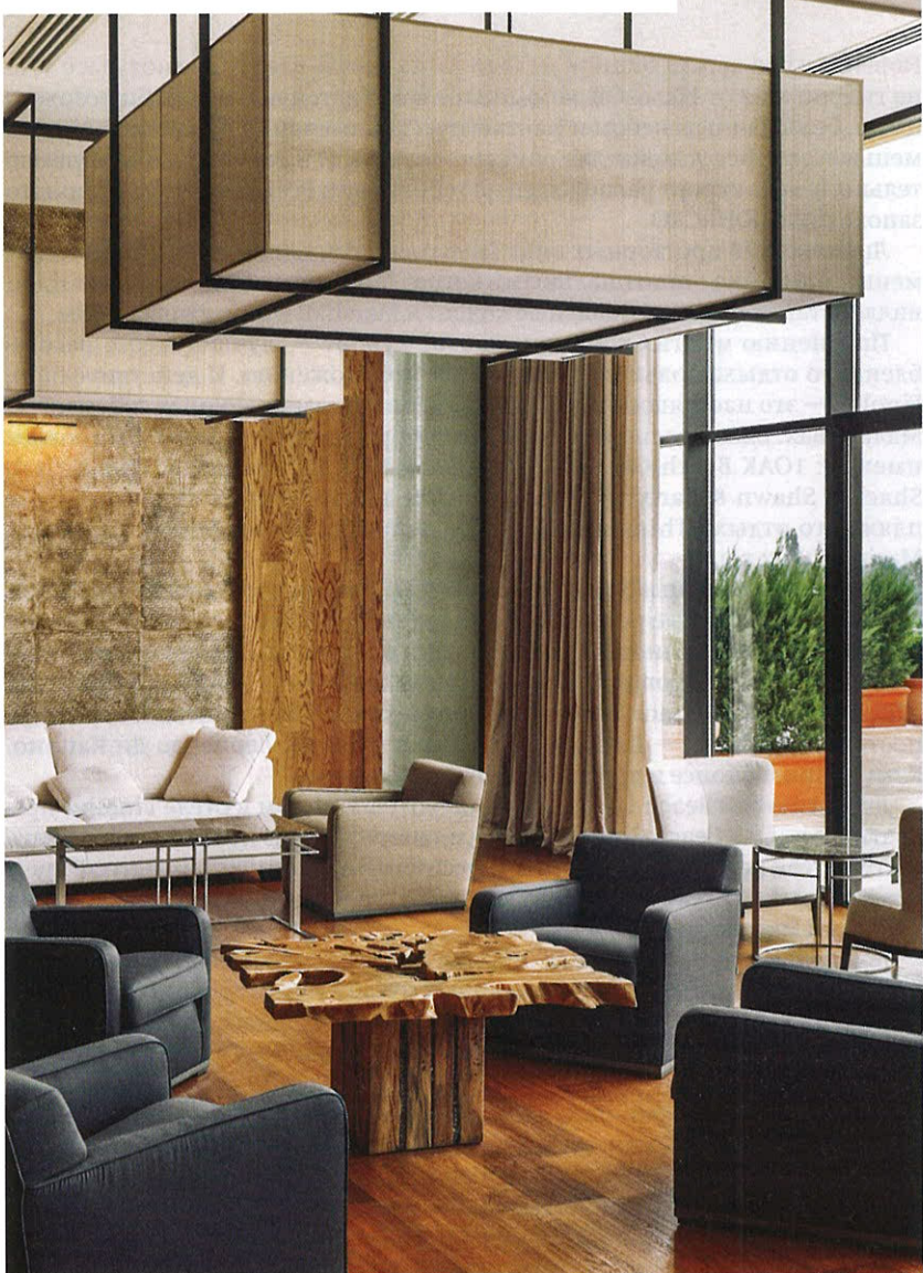
CHENOT PALACE HEALTH WELLNESS HOTEL