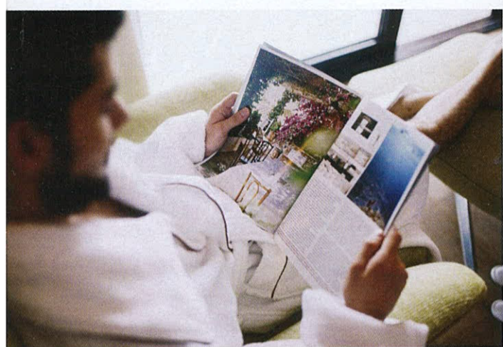
CHENOT PALACE HEALTH WELLNESS HOTEL