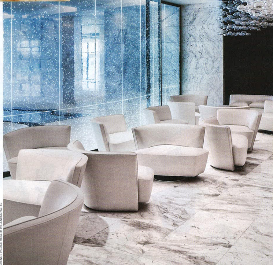
CHENOT PALACE HEALTH WELLNESS HOTEL

В новый Chenot Palace Gabala из Баку ехать около трех часов. Когда я об этом услышала, чуть было не отказалась от поездки. Сначала три часа лететь, а потом еще столько же трястись по не самым лучшим кавказским дорогам? Но любовь к Азербайджану и любопытство перевесили сомнения, и впоследствии я ни секунды не пожалела об этих неожиданно случившихся «азербайджанских каникулах».