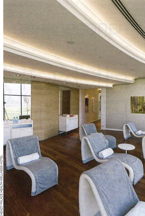
CHENOT PALACE HEALTH WELLNESS HOTEL